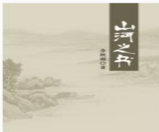
山河之书 余秋雨[著]