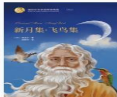
新月集·飞鸟集 (印)泰戈尔著