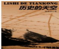
历史的天空 徐贵祥