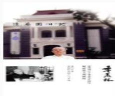
清华园日记 季羨林著