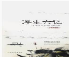
浮生六记 (沙画彩插版) 沈复著